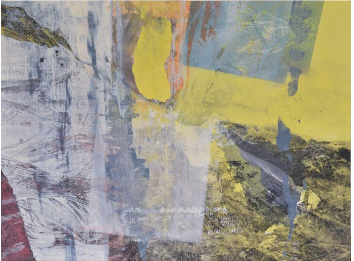
Christine Piot, Clairs-allants, Traversée , 2019 Tempera sur toile, 97 x 130 cm.