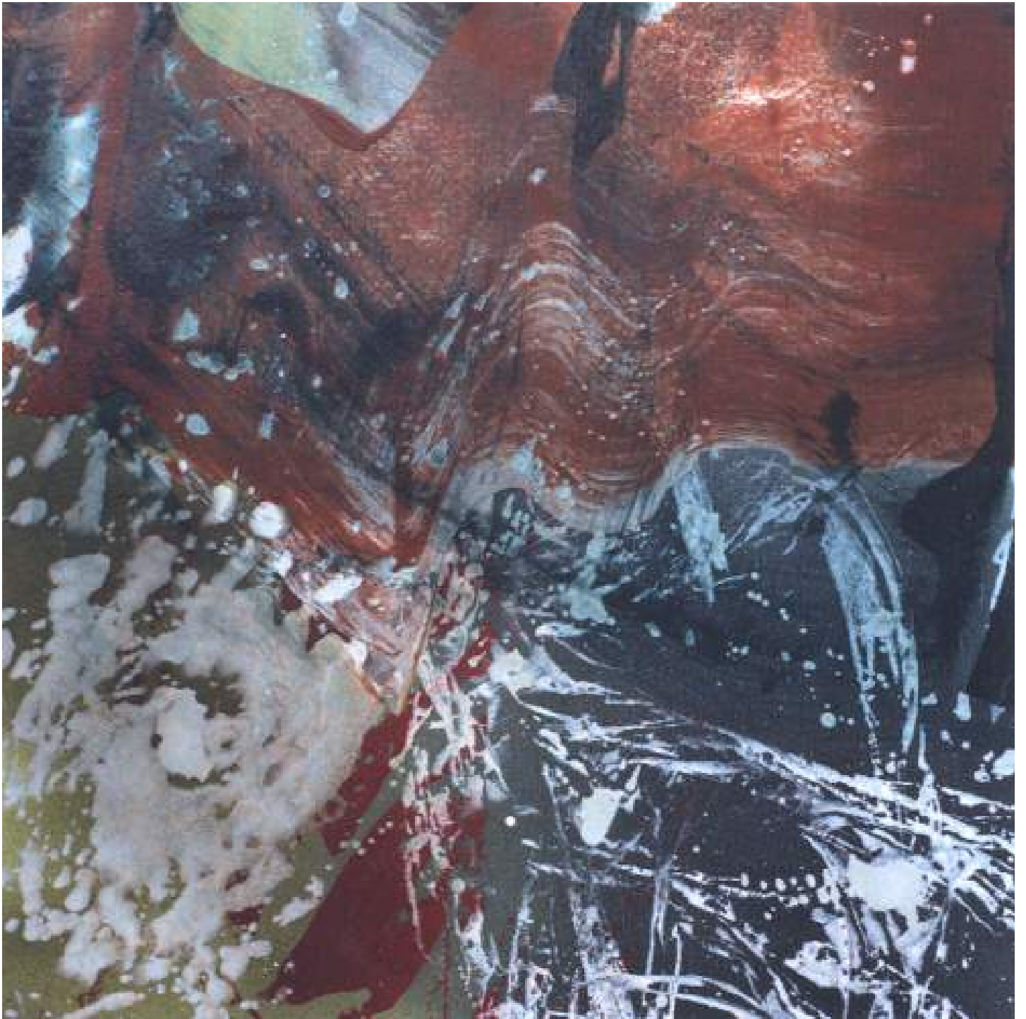
Christine Piot, Clairs-allants, Vertigo , 2017 Tempera sur toile, 80 x 80 cm.