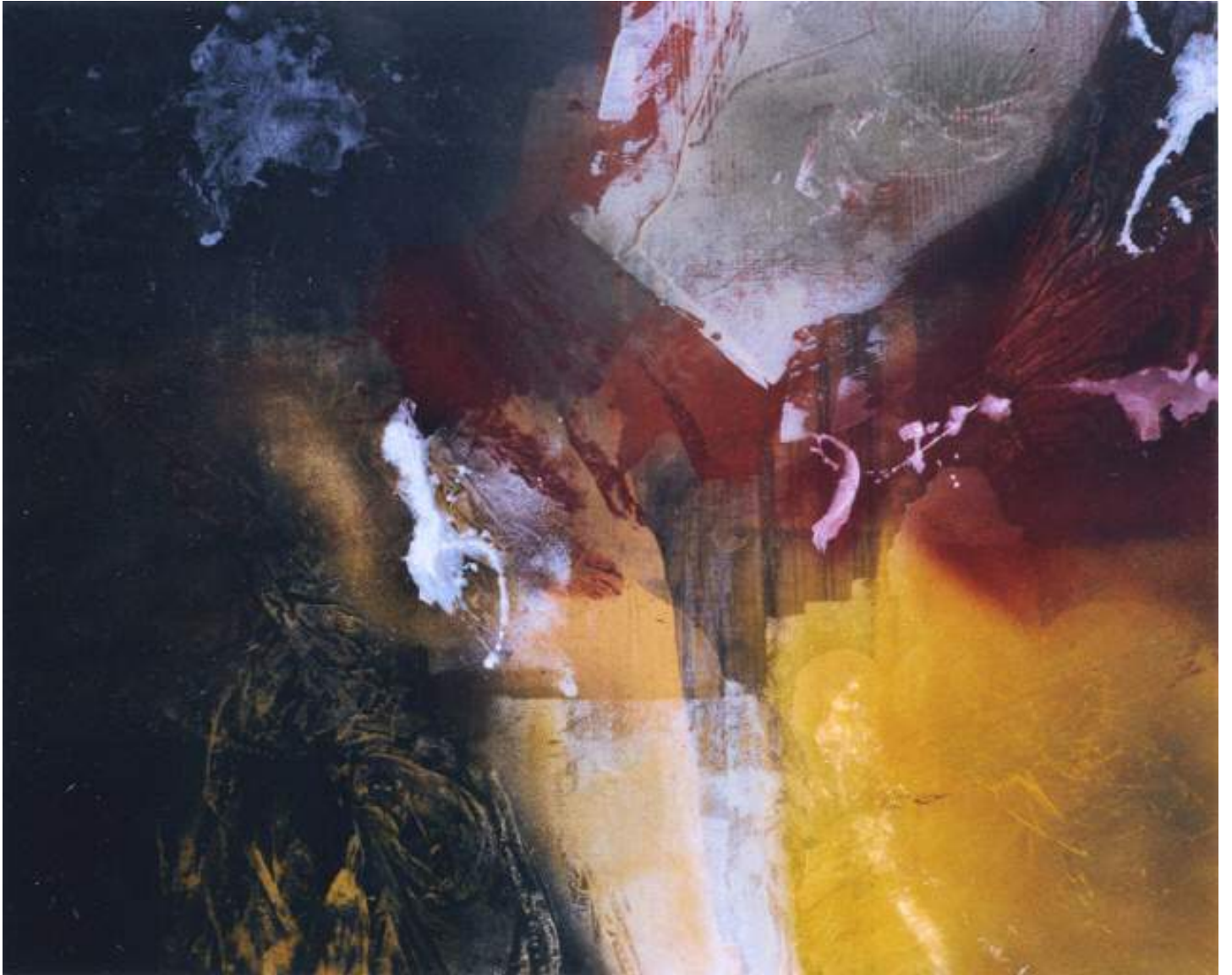
Christine Piot, Clairs-allants, L'orée , 2014 Tempera sur toile, 130 x 162 cm.