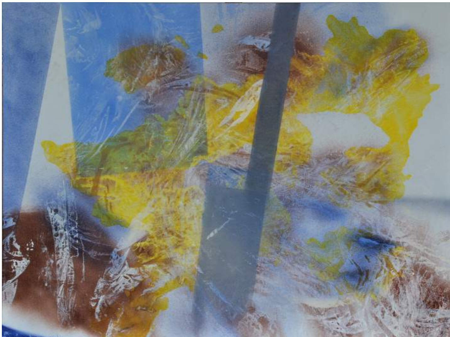
Christine Piot, Clairs-allants, À tout va , 2019 Tempera sur toile, 97 x 130 cm.