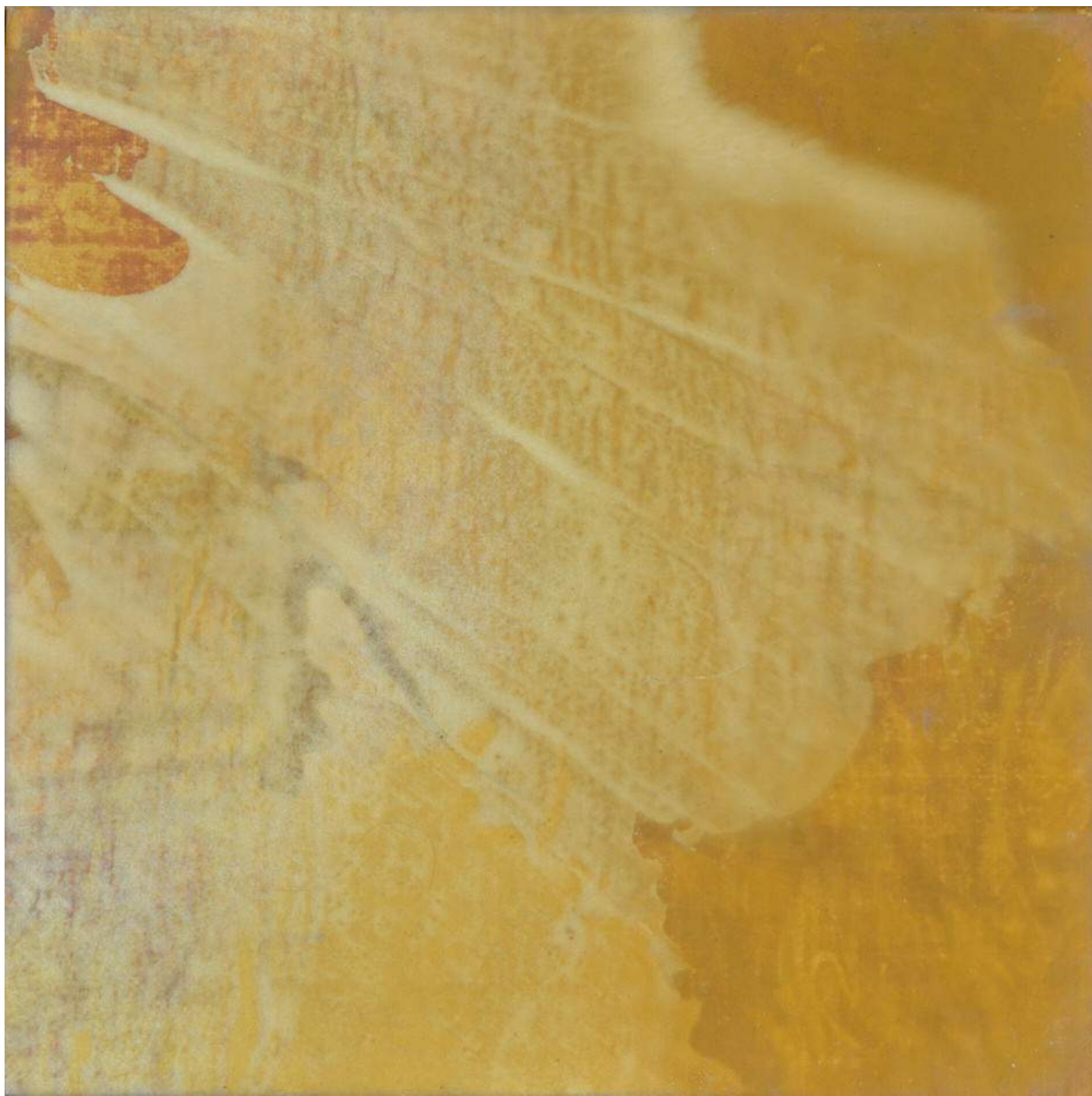
Christine Piot, Éclat n°8 , 2016 Tempera sur toile, 25 x 25 cm.