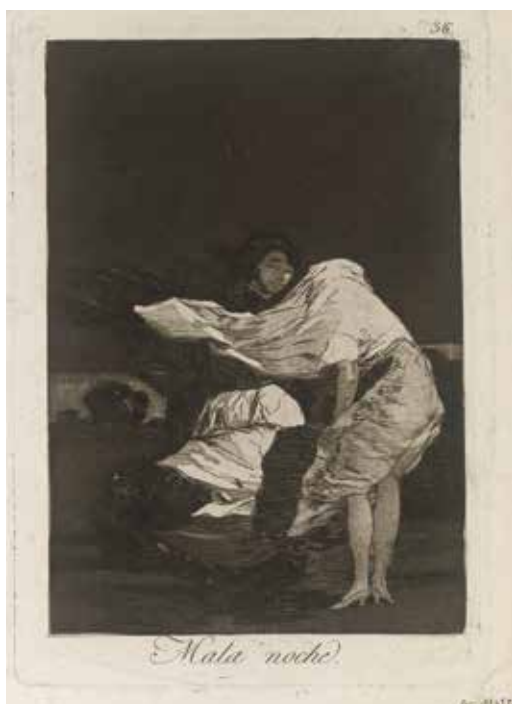
Francisco de Goya, Mala noche , 1799 Eau-forte et aquarelle sur vergé © Beaux-Arts de Paris