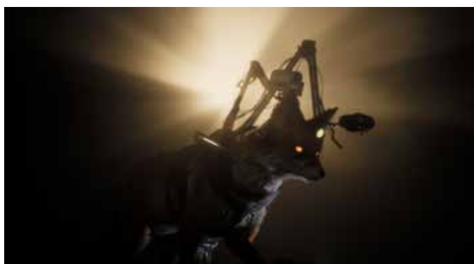
Saradibiza, TVSF , 2021 Vidéo, Production EXTRAMENTALE, Festival Octobre Numérique