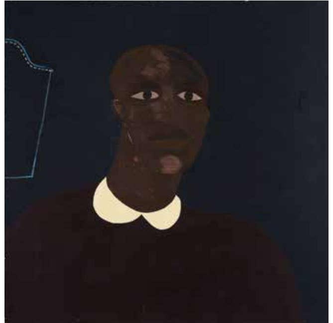
Lubaina Himid, William Cuffay's Sister , 1989, huile sur toile, 183 x 183 cm