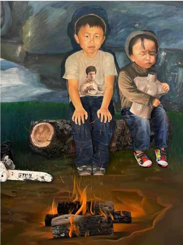
Alexandre Yang, Souvenirs de la Vie , 2024, huile sur toile, 180 x 270 cm