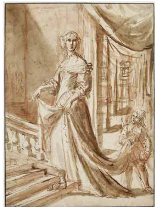
Elisabetta Sirani, Autoportrait avec un page , vers 1658, plume et encre brune, lavis brun sur tracé à la sanguine