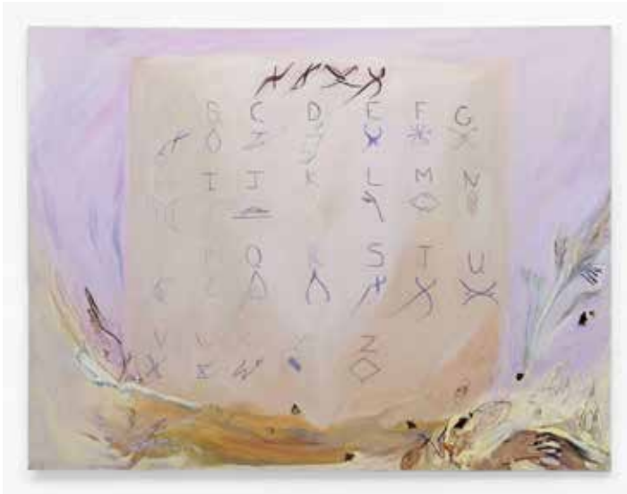
Séquoia Scavullo, SSS , 2022 Huile sur toile, 220 x 180 cm