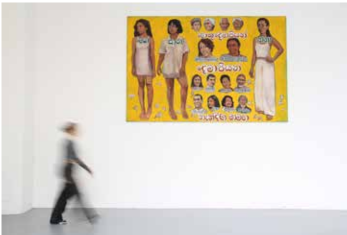
Nina Jayasuriya, Sans titre (pavulak) , 2023, huile sur toile, 200x300 cm