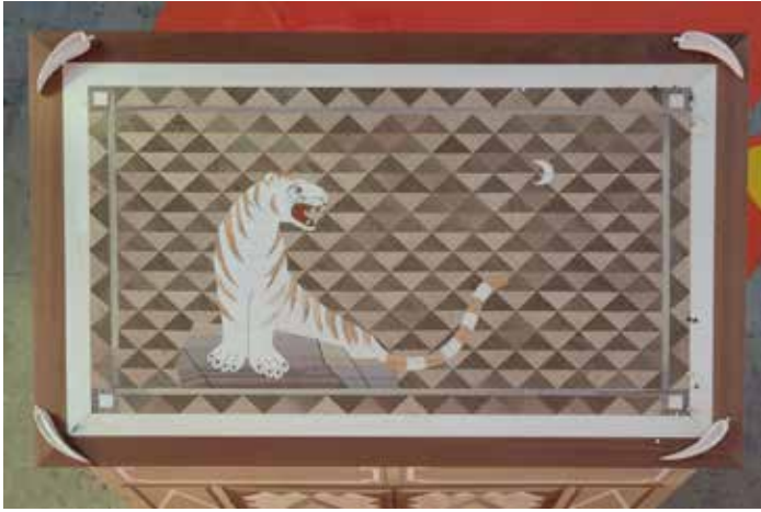
Wei Libo, Pure goodness (poires gelées) ; parfois je suis fatigué, j'arrête à penser, mais je ne veux pas me lâcher , 2021 Paires (acrylique peint sur bois divers), meuble de réplique en marqueterie fait par l'artiste, 115 x 65 x 90 cm