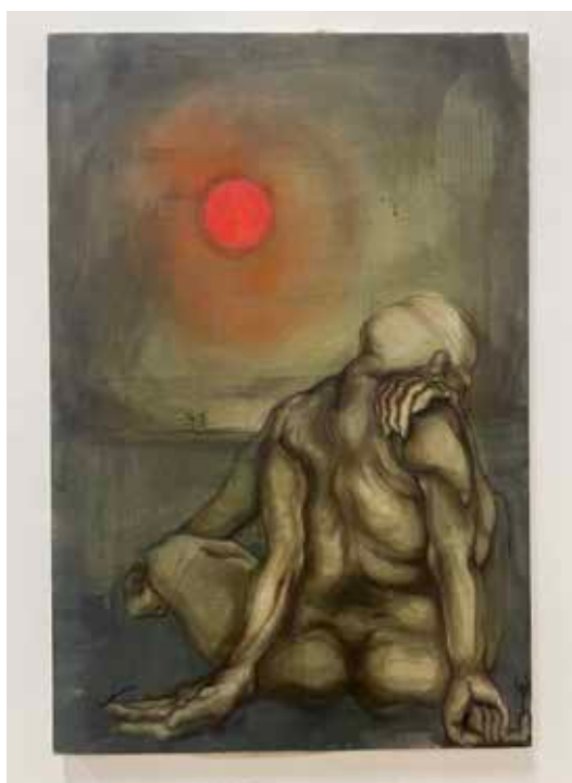
Malik Sehaj, Kali - l'entropie , 2023 Encre, fusain et peinture d'huile sur khadi (tissu indien), 60 x 90 cm