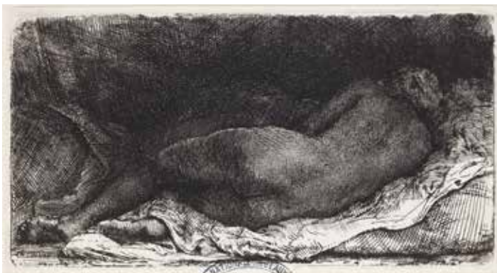
Rembrandt, Femme nue couchée , 1658 Eau-forte, pointe sèche et burin