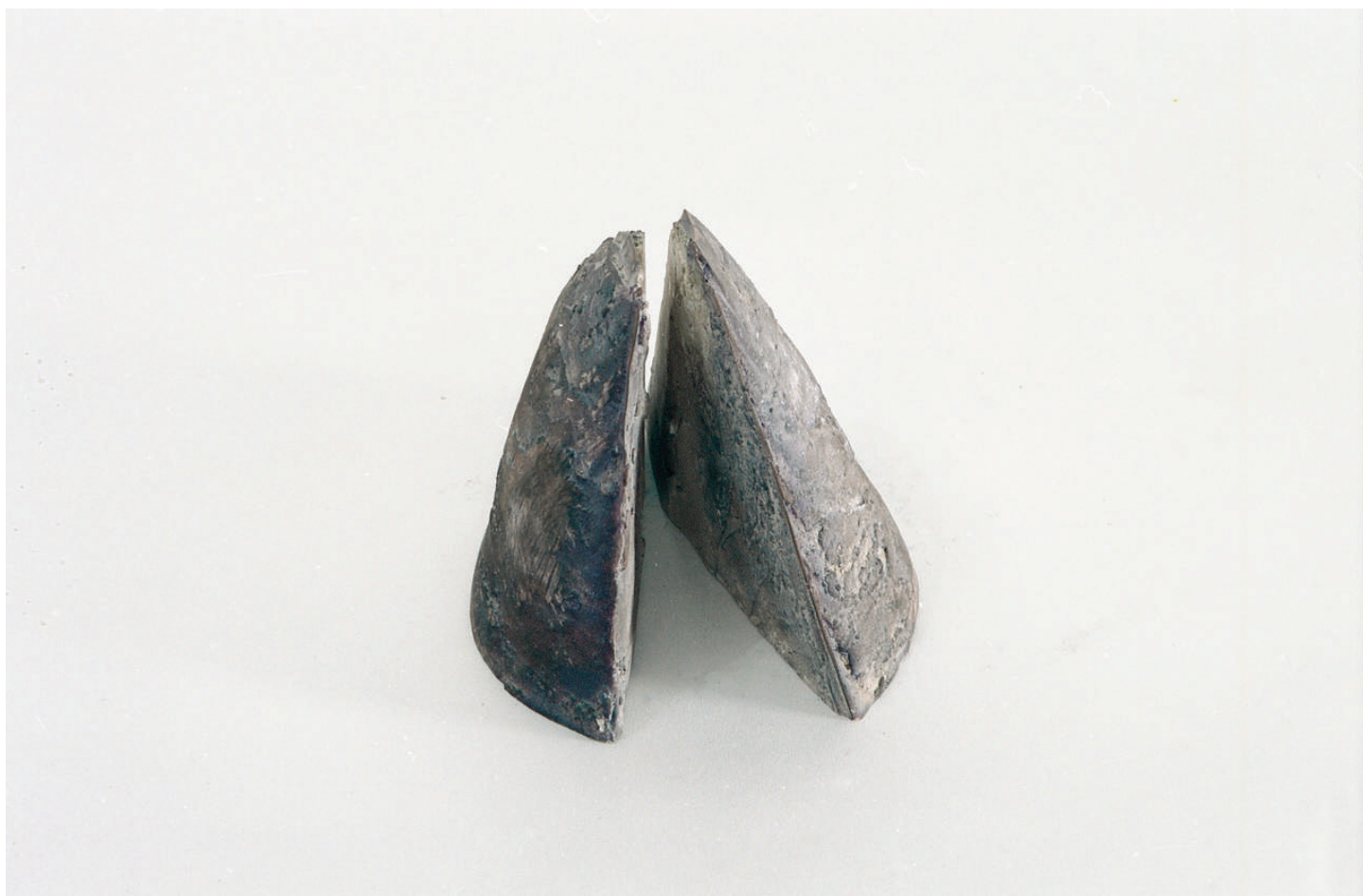
Helga Natz, No. 31 , 1989 Plâtre, 18 x 18 x 18 cm.

(merci de mentionner les légendes et les crédits pour les reproductions).