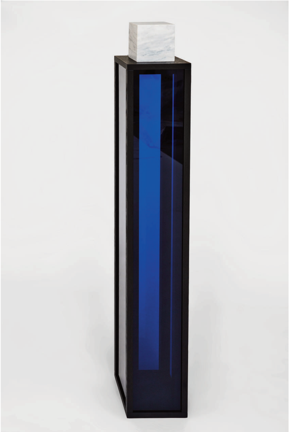
Helga Natz, No. 232, 2012 Acrylique, bois, marbre, 132 x 20 x 20 cm.