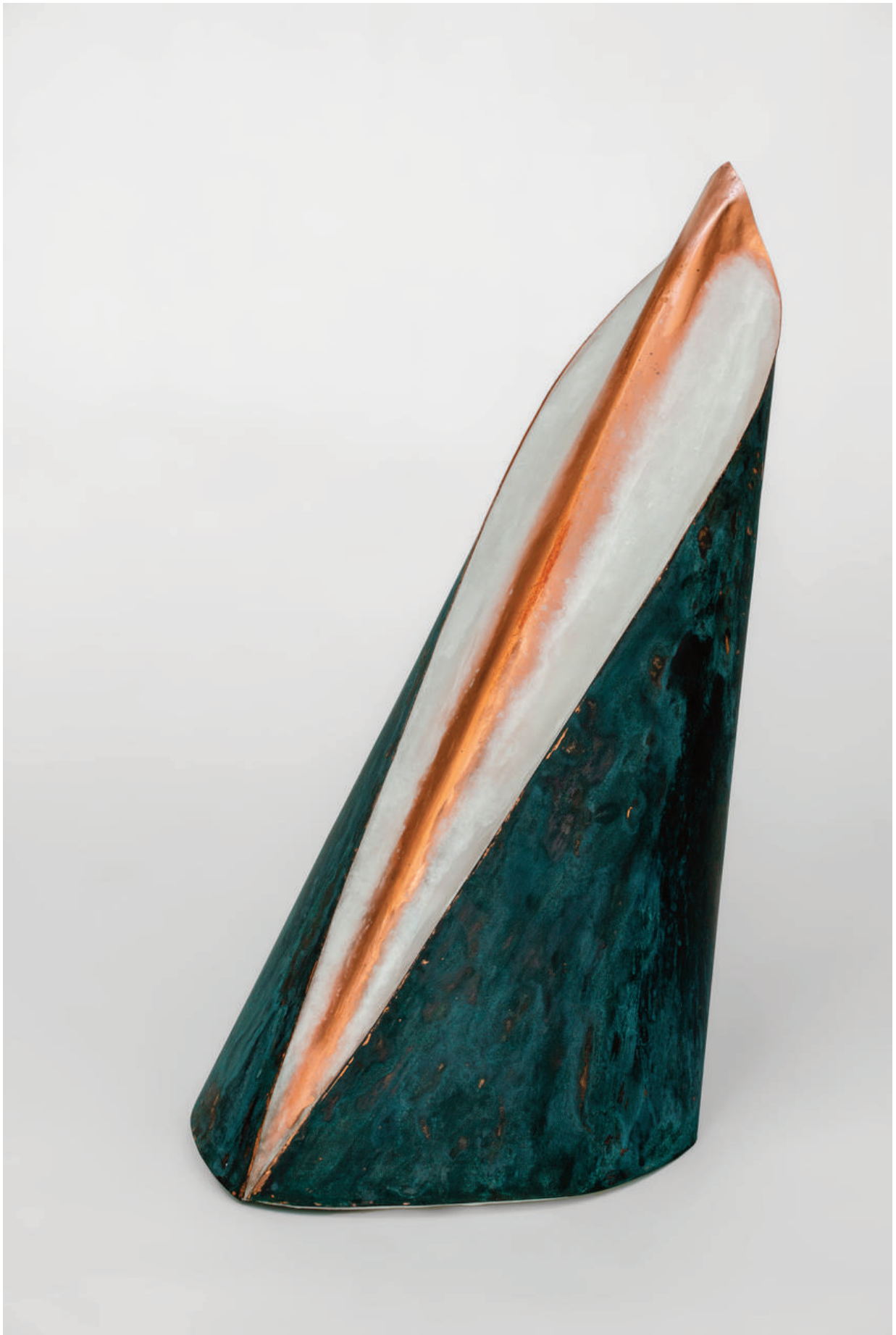
Helga Natz, No. 225, 2018 Cuivre, cire, 49,5 x 28 x 43 cm.